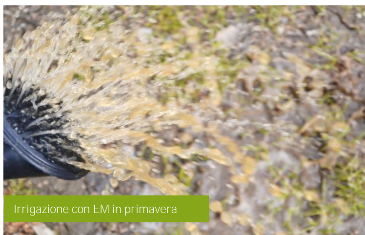
Irrigazione con EM in primavera

Distribuire la sostanza organica e mescolare nei primi 6 cm di suolo. Miscelare i microrganismi con la zeolite , la polvere di ceramica EM e Greengold , facendo in modo che le polveri si bagnino bene ed assorbano i liquidi. Aggiungere 10-15 lt di acqua, lasciar riposare per 30 minuti quindi distribuire sulla sostanza organica appena aggiunta. Attendere due settimane prima di proseguire con la semina o di piantare