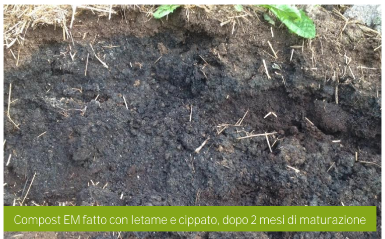
Compost EM fatto con letame e cippato, dopo 2 mesi di maturazione

Il tempo di maturazione è di circa 2 mesi e il